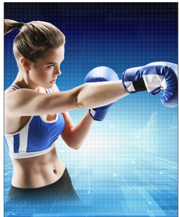
▲ Kraftvolle Software für die Organisation Ihrer professionellen Bildungsprojekte - TCmanager.

Im myTCmanager-Kalender sehen Trainer minutengenau ihre künftigen Einsatztermine und können selbstständig ihre Urlaubs-, Sperr- und Reisezeiten pflegen. Des Weiteren werden auch Detailinformationen zu Kurs, Equipment und Teilnehmern zur Verfügung gestellt. Anwesenheitslisten stehen zum Download bereit und können nach der Unterschrift wieder hochgeladen werden. Feedbackbögen ermöglichen dem Trainer, seinen Eindruck zu Kursverlauf und Raum zu dokumentieren.